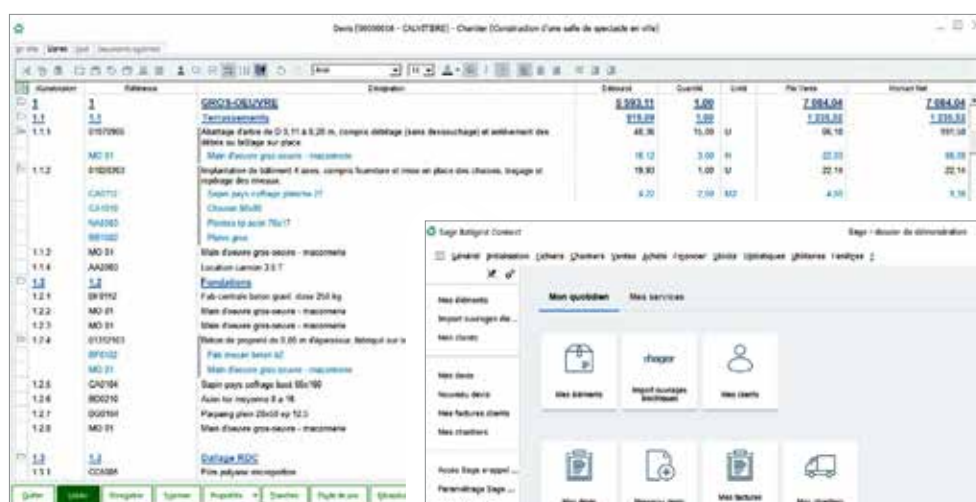
étude chiffrage devis

Liaison et transfert des rubriques salariés (heures, paniers...) vers Sage 100 Paie & RH