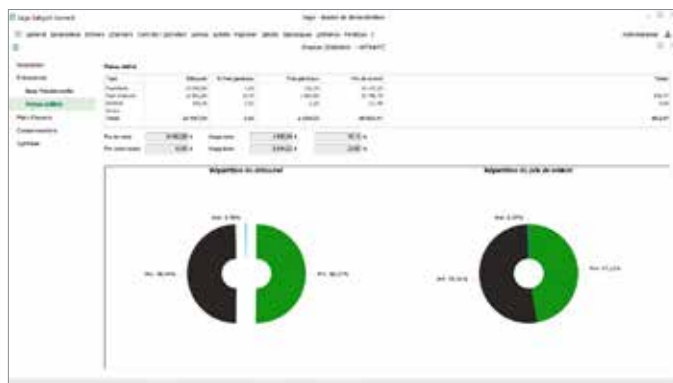
Interface chantier simplifié